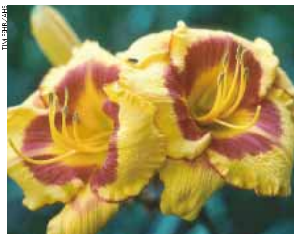
'Fooled Me' är en ny sort med livlig färgställning som blommar länge.