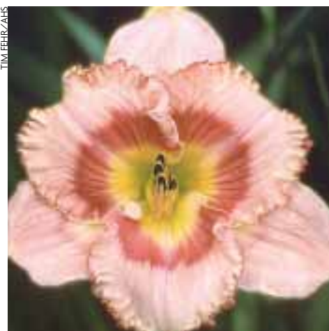
'Wild Mustang' är en mycket eftertraktad sort från Stamile.