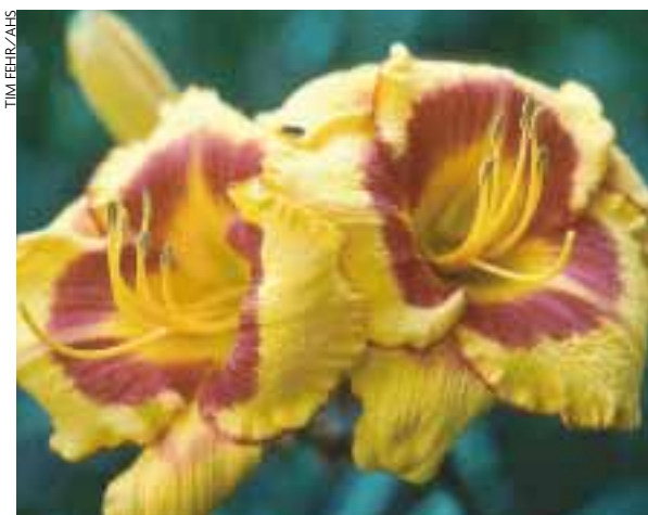
'Fooled Me' är en ny sort med livlig färgställning som blommar länge.