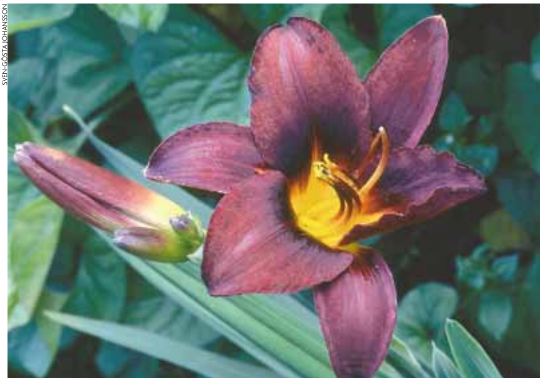
'American Revolution' är mycket populär i England. Det är en medelhög sort som har knoppar i färg.

I Sverige dominerar gamla beprövade trotjänare som 'Stella d'Oro',