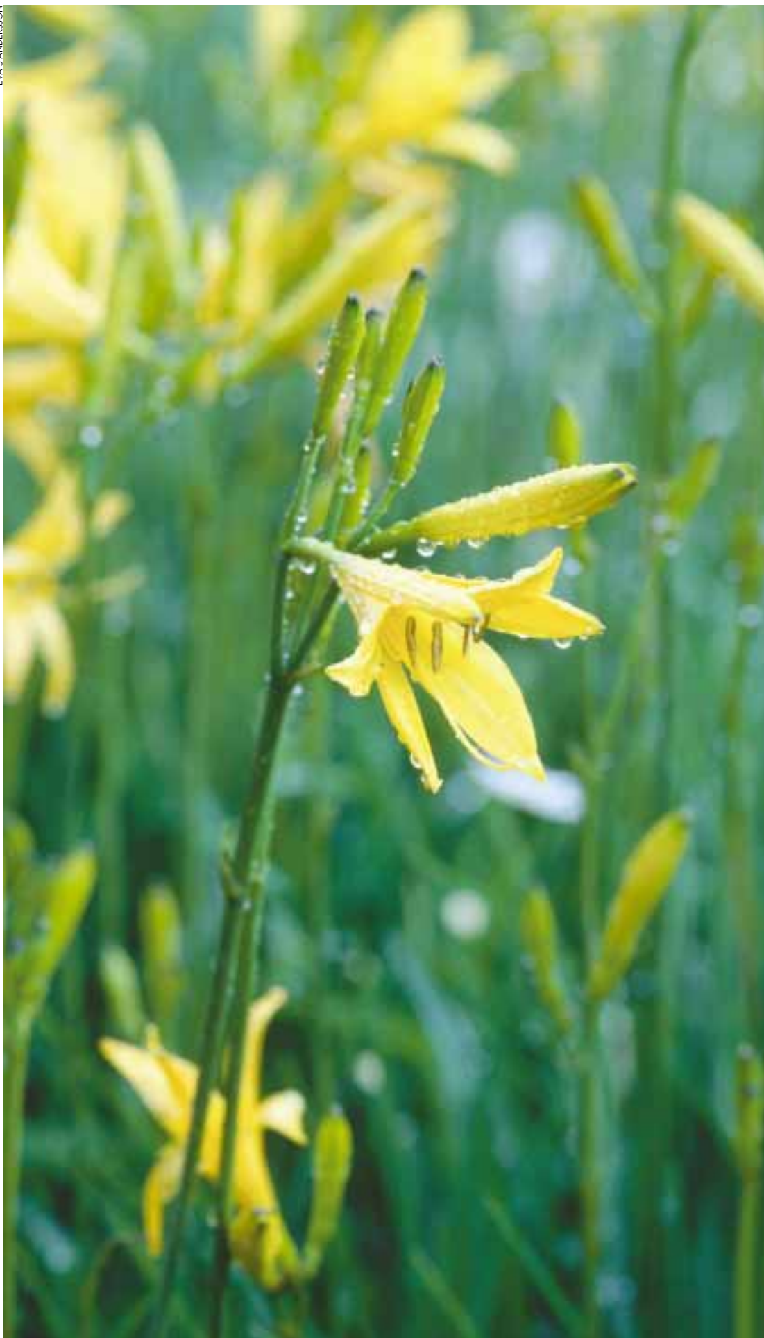
Den vilda gula dagljiljan, Hemerocallis lilioasphodelus , blommar tidigt.