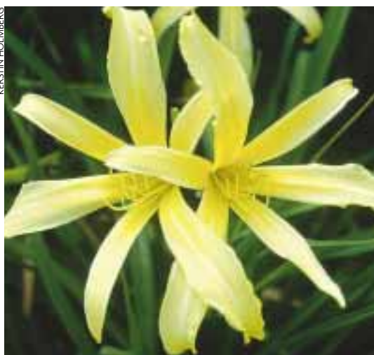
'Kindly Light' har den klassiska spindelformen. Kom redan på 1950-talet.