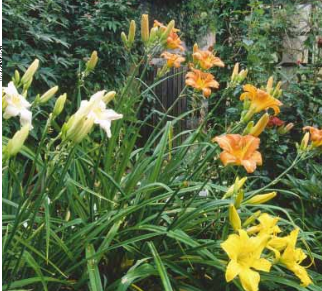
Färgmässigt matchar daglilior varandra fint tack vare den gula undertonen.

8 Efter sju–tio dagar börjar de gräslika groddarna komma upp. Plantera dem i krukor efter några veckor och