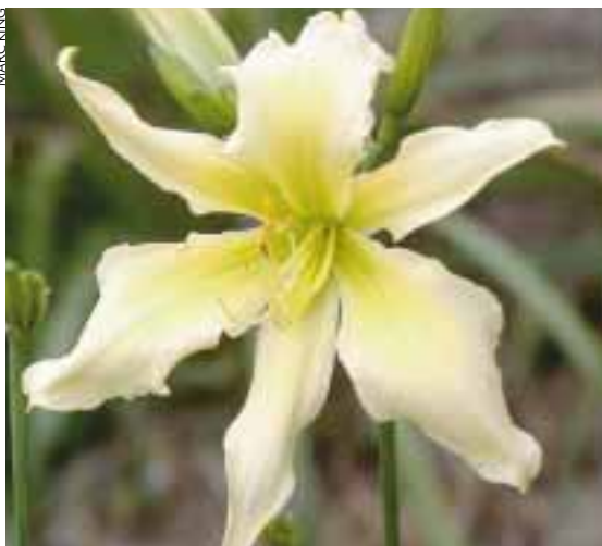
Spindelvarianter av Marc King på Casa Rocca Gardens. 'Moonlit Summerbird' och 'Dancing